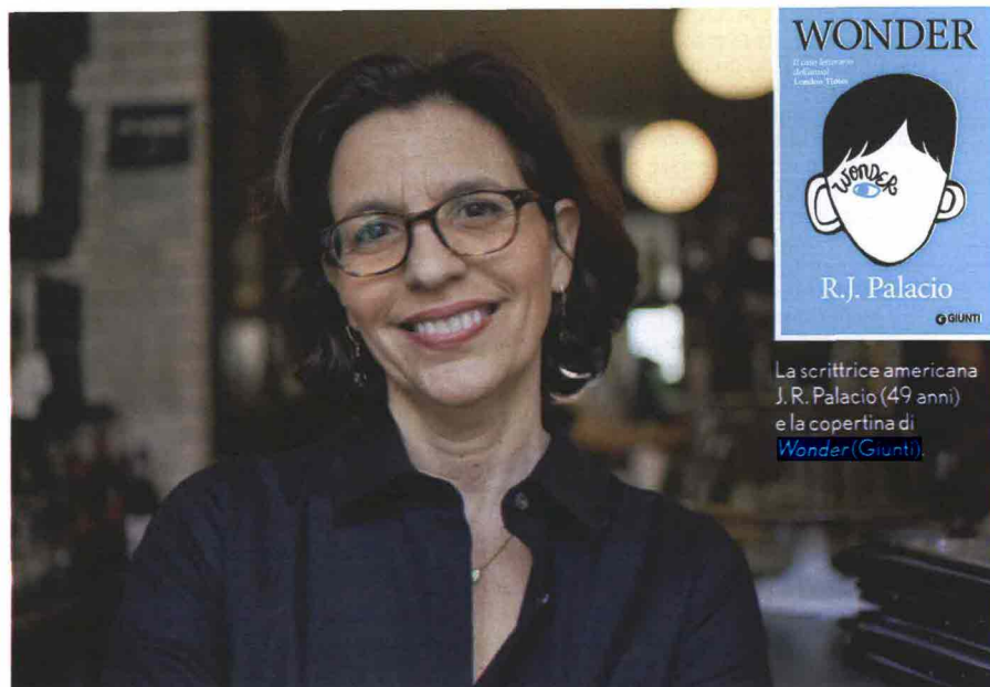
La scrittrice americana J.R. Palacio (49 anni) e la copertina di Wonder (Giunti).

paura della reazione che i miei figli avrebbero potuto avere e sono scappata. Temevo ne restassero scioccati e che la madre della piccola percepisse il nostro disagio. Mi sono sentita un verme». Da quell'episodio, è nata questa bella storia. Commovente, raccontata da August stesso, consapevole di non essere un bambino ordinario, da sua sorella Via, da alcuni compagni di scuola (talvolta amici, altre volte nemici). Un romanzo-realtà che si interroga sul senso dell'accettazione e dell'integrazione per chi nasce infelice, scritto per i giovanissimi, perché i bambini sono capaci di una visione profonda e pura. Ma anche per tutti quegli adulti che si trovano a combattere quotidianamente per i propri figli, specie se diversi. Un libro che racconta come, da vicino, nessuno può essere considerato "normale". T